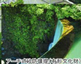
アーチ式砂防堰堤(有形文化財)