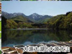
大源太湖と大源太山